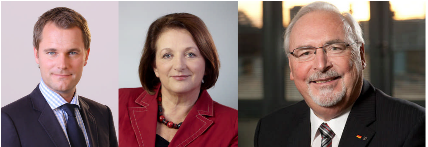
Bundesgesundheitsminister Daniel Bahr, Bundesjustizministerin Sabine Leutheusser-Schnarrenberger und der Patientenbeauftragte der Bundesregierung, Wolfgang Zöller, haben in dieser Woche den gemeinsamen Gesetzentwurf vorgelegt.

Sechs von zehn Patienten kennen laut einer Studie ihre Rechte gar nicht oder unvollständig. Nun werden die Patientenrechte endlich greifbar. Das neue Gesetz gleicht das Informationsgefälle zwischen Arzt und Patient aus. Auch für die Behandlungsseite bringt das Gesetz Klarheit und Verlässlichkeit. Bald können die wichtigsten Rechte und Pflichten im Gesetz selbst nachgelesen werden.