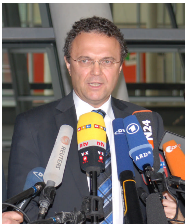
Leitet die Islamkonferenz: Der neue Bundesinnenminister Hans-Peter Friedrich (CSU).

Die Islamkonferenz ist der richtige Ort, um auch kritischen Themen offen anzusprechen, so wie es Bundesminister Friedrich getan hat. Umso unverständlicher ist die teilweise geäußerte Kritik daran, dass dort auch Fragen der inneren Sicherheit behandelt werden. Die SPD hat nach der Islamkonferenz die Muslime sogar zum Boykott weiterer Treffen aufgerufen – was mir völlig unverständlich ist. Der Bundesinnenminister hat lediglich vorgeschlagen, eine Sicherheitspartnerschaft mit den muslimischen Verbänden und Gemeinden einzurichten, um sich klar von denjenigen abgrenzen, die die Religion für terroristische Zwecke missbrauchen. Die in Deutschland lebenden Muslime müssen unsere Verfassungsgrundsätze bedingungslos akzeptieren. Der Islam hat keinen Vorrang gegenüber unseren Gesetzen!